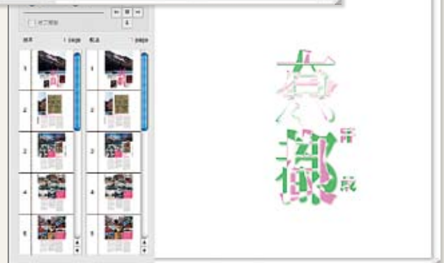
差分のみの表示も可能